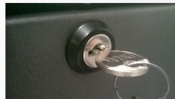
Türverschluss mit 2 Schlössern