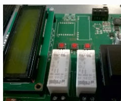
Temperaturcontroller: Heizung und Lüftung